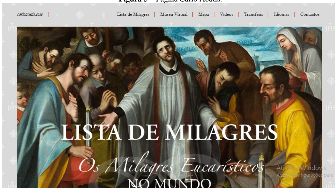
Figura 3 – Página Carlo Acutis.

a fé católica a presença do corpo de Jesus Cristo na hóstia sagrada. O Miracolie Eucaristici é hoje mantido e alimentado pelo Vaticano, com mapas, listas dos milagres e acesso em diversos idiomas para facilitar a difusão dos textos. A figura 3 mostra a página inicial e os tópicos que o site contém, sendo um legado de Acutis e um marco para o vínculo entre a Igreja Católica, as mídias digitais e os jovens.