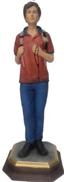
Figura 1 – Imagem Carlo Acutis

Fonte: site Loja Todos os santos , 2025. 2