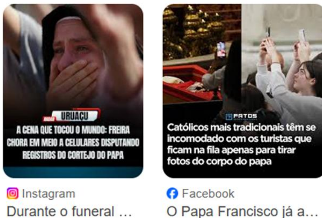
Figura 7- Funeral Papa Francisco

Uma rápida pesquisa no Google mostrou inúmeras matérias jornalísticas que abordam o fato, além de publicações e imagens em redes sociais de cidadãos que entraram no debate, a figura 7 evidencia esse momento ao retratar lado a lado duas manchetes sobre. A primeira manchete chama atenção por mostrar que o luto expressado no choro de uma freira se destacou em meio a horda de celulares; em outra surge o debate da tradição, mostrando que os católicos que presam pela tradição dos ritos ficaram incomodados com tal comportamento.