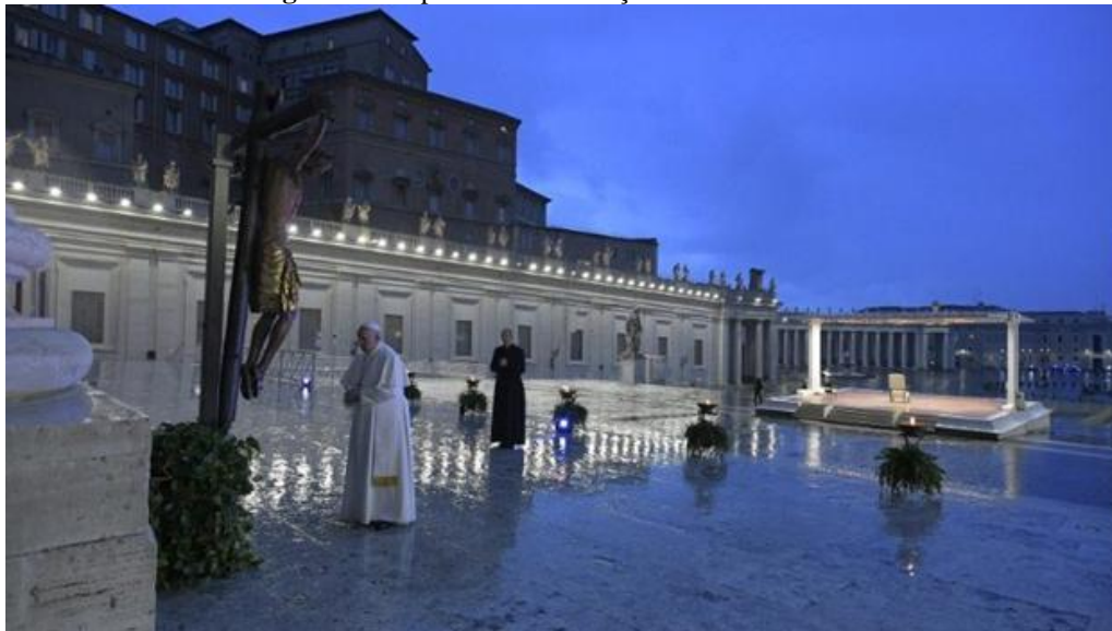
Figura 6 – Papa Francisco benção Urbi et Orbi 2020

solitário na praça e falando para o espaço físico vazio mesmo que assistindo por muitos pelos canais de transmissão (figura 6).