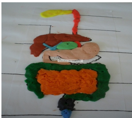
Figura 3. Exemplo de atividade de manipulação com massinha de modelar.

A mobilidade motora também foi foco na atividade de manipulação, onde os alunos deverão estruturar sistemas orgânicos com massa de modelar, para que assim possam trabalhar a coordenação motora limitada seja ela fina, geral ou específica. Observe na imagem abaixo.