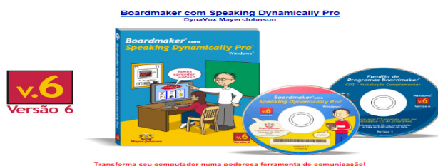
Figura 2. Software Boardmaker ferramenta para inserção tecnológica.

Estas adaptações físicas são pequenas formas de permitirem que os alunos sejam capazes de manipular o material escolar de forma segura, favorecendo sua interação com os demais colegas. Pensando também na interação de alunos com DF profunda, ou alunos com DF associada a outras limitações, apresentamos aos participantes o Software Boardmaker , este recurso consiste em um programa que permite ao professor adaptar atividades para o computador permitindo o aprendizado do aluno.