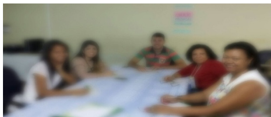
Figura 5. Foto dos participantes do minicurso

Após desenvolvimento do minicurso foi solicitado aos participantes que respondessem uma ficha avaliativa, a figura abaixo mostra o registro dos participantes no momento da avaliação. Sobre a expectativa dos participantes em relação ao minicurso, 100% dos participantes responderam que suas expectativas foram atendidas. O participante P1 ainda salientou que: “a abordagem prática foi muito produtiva, apontar ideias de atividades práticas é mais interessante do que ficar só na teoria”.